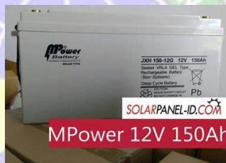
gambar 4. 1 Baterai solar cell

Lampu LED 56 watt dengan masa pakai 6 tahun Rp.150.000,00/unit