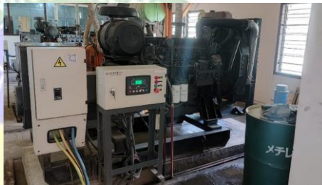
gambar 3. 1 Genset 250 kVa

Genset ini membackup Gedung terminal, Gedung kantor, Gedung tower dan Gedung operasional lainnya di area sekitar kantor UPBU Fransiskus Xaverius Seda Maumere. Genset ini bertempat di Power House bandara.