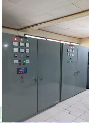
gambar 3. 3 ACOS