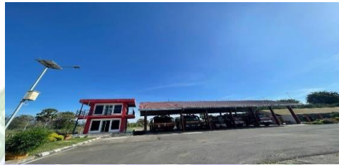
gambar 2. 8 Bangunan PKP-PK

Pertolongan kecelakaan penerbangan dan pemadam kebakaran (PKP-PK) merupakan unit bagian dari penanggulangan keadaan darurat di bandar udara untuk memberikan pertolongan kecelakaan penerbangan dan pemadam kebakaran.