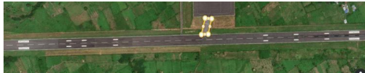
gambar 2. 3 Taxiway bandara

Taxiway adalah jalan penghubung antara Runway dengan Apron . Berikut adalah Gambar Taxiway Bandar Udara Fransiskus Xaverius Seda Maumere: