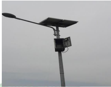
gambar 3. 6 PJU Solar cell

terkena bayangan suatu benda, dan sudut kemiringan pemasangan solar panel.