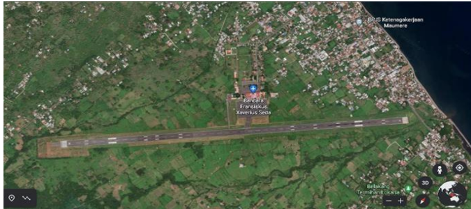
gambar 2. 1 Layout Bandara Fransiskus Xaverius Seda Maumere

Bandar Udara Fransiskus Xaverius Seda merupakan sebuah bandar udara yang terletak Di Kota Maumere, Kabupaten Sikka, Provinsi Nusa Tenggara Timur, Indonesia. Bandar udara ini telah mengalami perkembangan yang cukup pesat untuk meningkatkan kualitas pelayanan. Maskapai penerbangan yang beroperasi di Bandar Udara Fransiskus Xaverius Seda Maumere adalah pesawat jenis Boeing 737-500 ( Nam Air), ATR 72-500/600 (Wings Air).