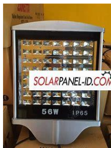
gambar 4. 2 Lampu LED solar cell