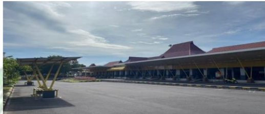
gambar 2.5 Terminal Bandara

perpindahan intra dan antarmoda transportasi, yang dilengkapi dengan fasilitas keselamatan dan keamanan penerbangan, serta fasilitas pokok dan fasilitas penunjang lainnya sebagai tempat perpindahan antar moda transportasi(WA, n.d.). Seperti pada gambar berikut.