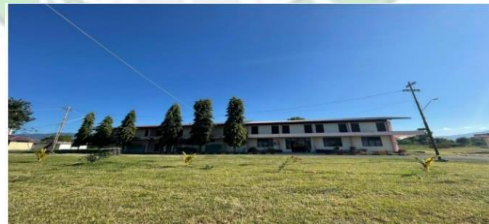
gambar 2. 7 Power House

Gedung Power House (PH) sering disebut juga dengan rumah pembangkit yang berisi seluruh fasilitas dan peralatan pada Gedung Power House bermanfaat sebagai Back Up daya listrik apabila terjadi pemadaman dari PLN, sehingga operasional penerbangan dapat berjalan lancar.