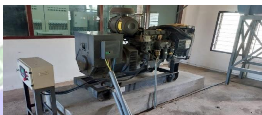
gambar 3. 2 Genset 100 Kva

Genset ini berperan penting dalam membackup genset 250 kVA jika terjadi kekurangan daya. Genset ini ditempatkan di Power House bandara.