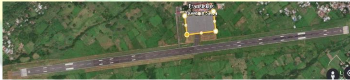
gambar 2. 4 apron bandara