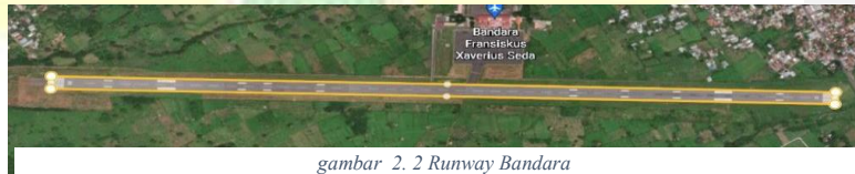
gambar 2. 2 Runway Bandara