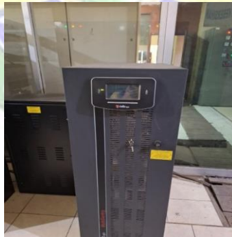
gambar 3. 4 UPS 40 Kva