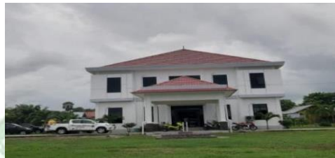
gambar 2. 6 Gedung Administrasi

Gedung Administrasi adalah Gedung yang di gunakan untuk pengurusan administrasi Bandar Udara. Gedung Administrasi Bandar Udara Fransiskus Xaverius Seda adalah gambar berikut :