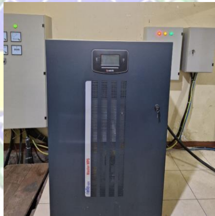
gambar 3. 5 UPS 80 kVA