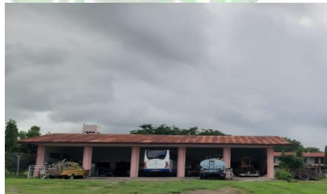
gambar 2. 9 Gedung AAB sumber : dokumentasi penulis

Gedung AAB atau Alat Alat Berat adalah gedung yang digunakan sebagai tempat untuk memperbaiki dan merawat alat-alat berat dan kendaraan Operasional. Gedung AAB seperti pada gambar berikut :