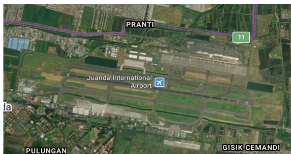
Gambar 3.3 Lokasi Bandar Udara Internasional Juanda Surabaya

Tempat penelitian Tugas Akhir ini penulis mengambil lokasi di Bandar Udara Internasional Juanda Surabaya