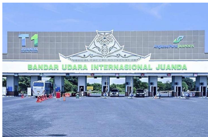
Gambar 1.1 Bandar Udara Internasional Juanda Surabaya (Juanda airport, 2022)

Bandara Internasional Juanda yang berada di Sidoarjo, Jawa Timur, berperan sebagai salah satu pusat utama transportasi udara di kawasan timur Indonesia. Sebagai bandara tersibuk kedua di tanah air setelah Soekarno-Hatta, Juanda memiliki peran penting dalam mendukung pergerakan penumpang dan barang, baik dalam negeri maupun lintas negara. Namun, peningkatan volume penerbangan dari tahun ke tahun menimbulkan tantangan signifikan, terutama terkait keterbatasan kapasitas ruang udara ( airspace capacity ).