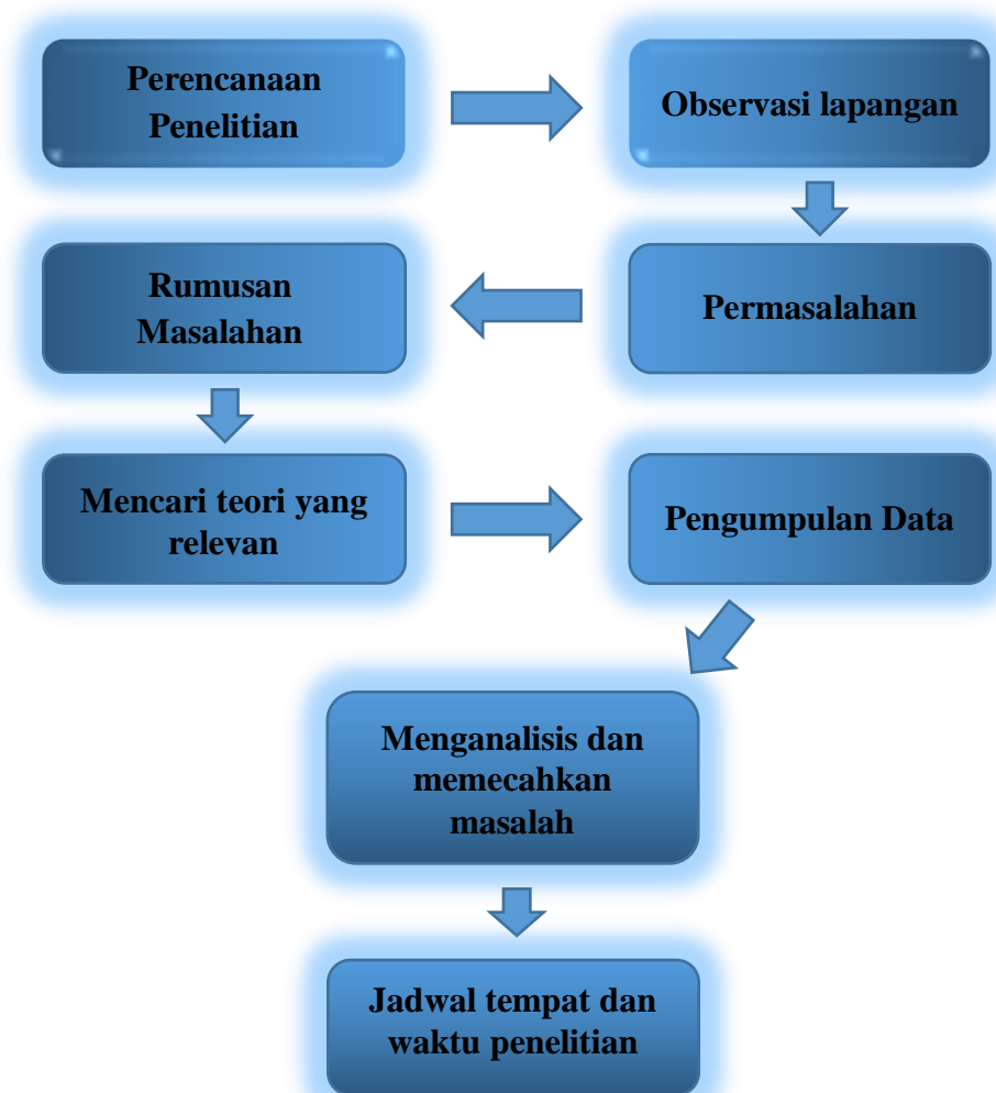
Gambar 3.1 Desain Penelitian

Desain penelitian adalah desain mengenai keseluruhan proses yang diperlukan dalam perencanaan dan pelaksanaan penelitian, (Jumantara, 2021). Berikut adalah tahapan yang dilakukan dalam pelaksanaan penelitian ini :