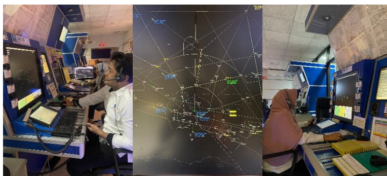
Gambar 3.2 Dokumentasi pada saat pengambilan data

Dokumentasi adalah sebuah cara untuk memperoleh informasi dan data dalam bentuk buku, arsip, dokumen, tulisan angka dan gambar yang berupa laporan serta keterangan yang dapat mendukung sebuah penelitian.